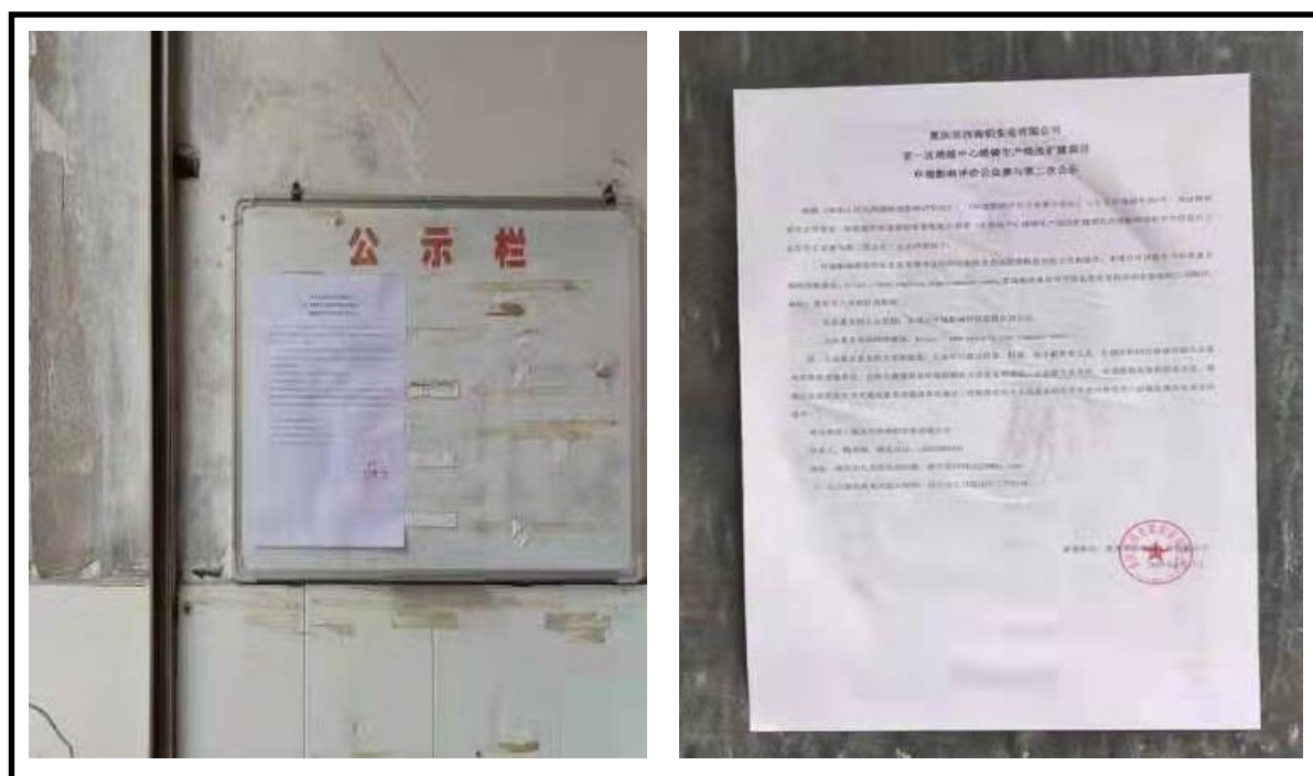
图5 第二次公示现场张贴公示图片