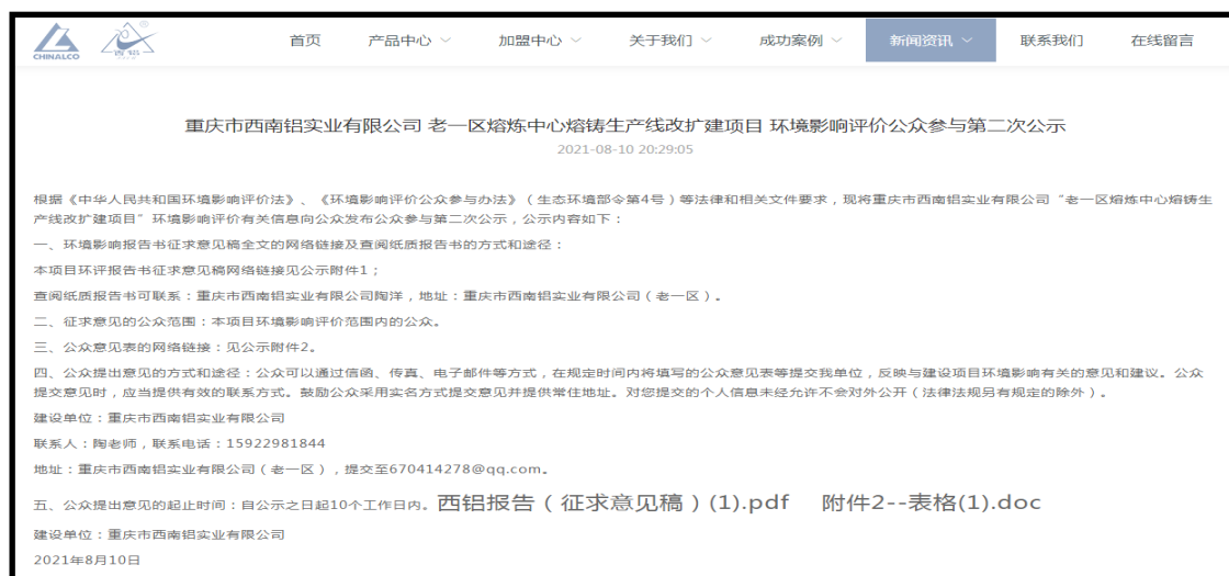
图2 第二次网络公示截图