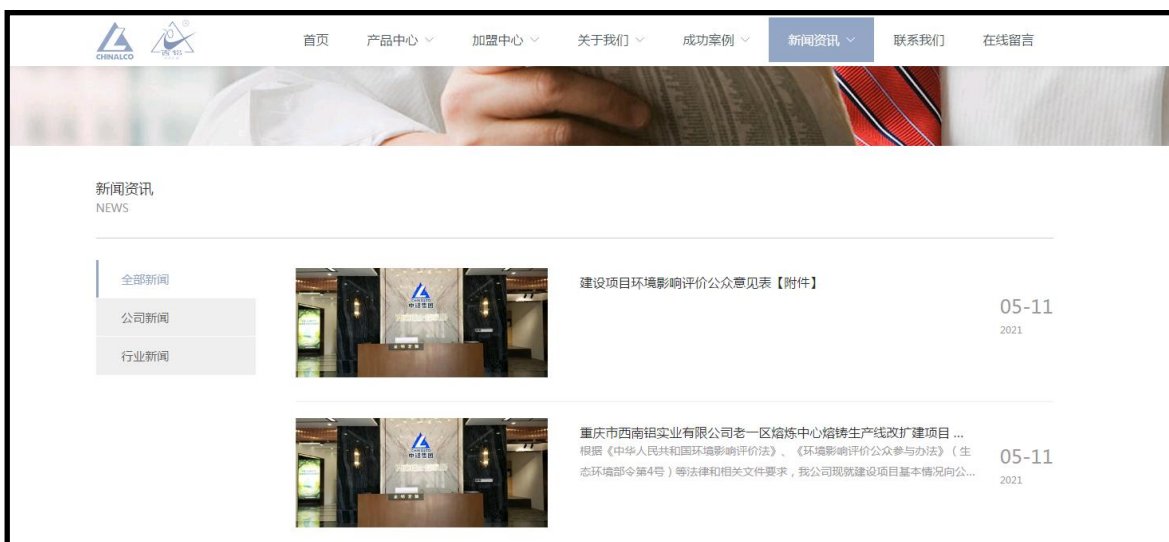
图1 第一次公示截图