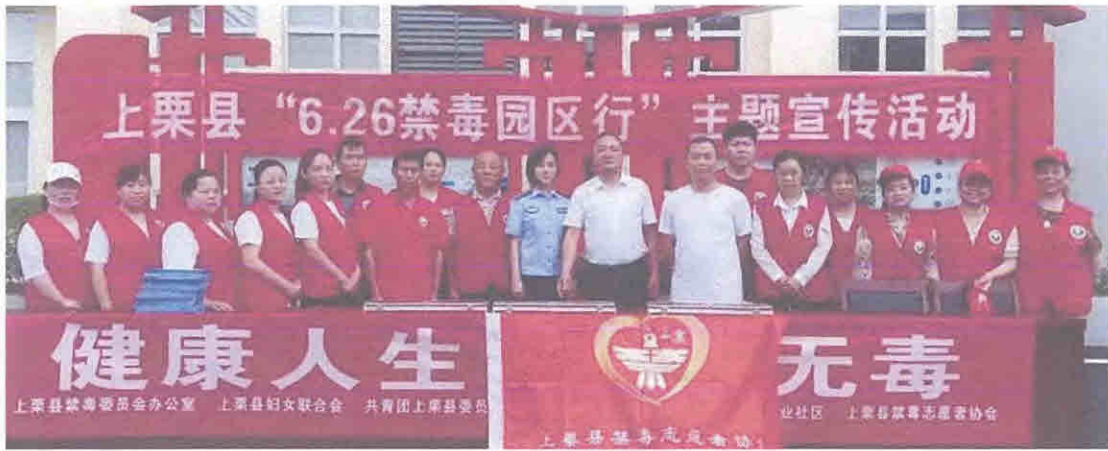
“6.26 禁毒园区行”主题宣传活动