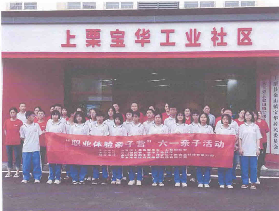
“职业体验亲子营”六一亲子活动