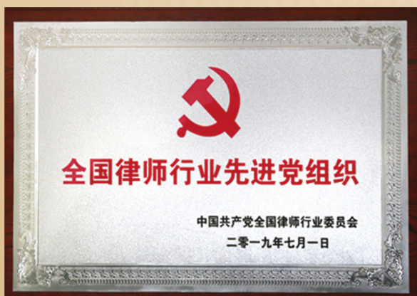
全国律师行业先进党组织