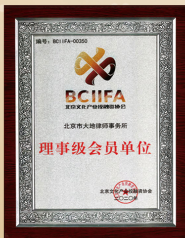
北京文化产业投融资协会 理事级会员单位