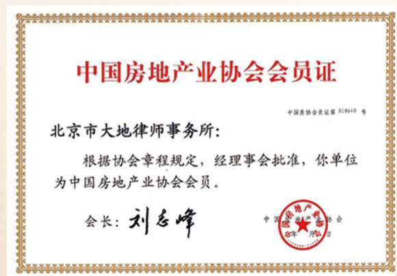
中国房地产业协会会员