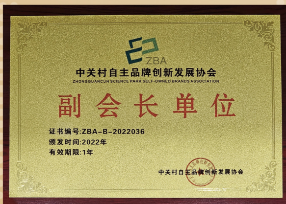
中关村自主品牌创新发展协会 副会长单位