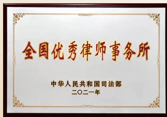
全国优秀律师事务所