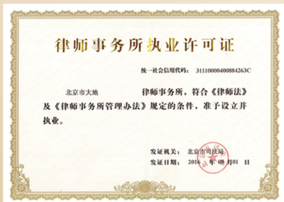
律师事务所执业许可证