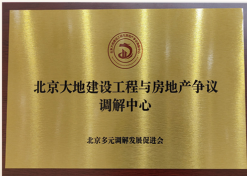
北京大地建设工程与房地产争议调解中心

北京市大地律师事务所率先在首都综治办、北京市高级人民法院领导下的全国首家省一级、行业性专业调解组织“北京多元调解发展促进会”设立了“大地建设工程调解分中心”，专门从事房地产、建设工程类纠纷调解，不断提升专业法律服务水准。