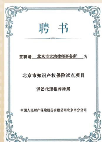
北京市知识产权保险试点项目 诉讼代理推荐律所