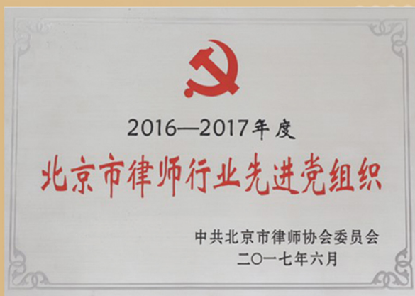
北京市律师行业先进党组织